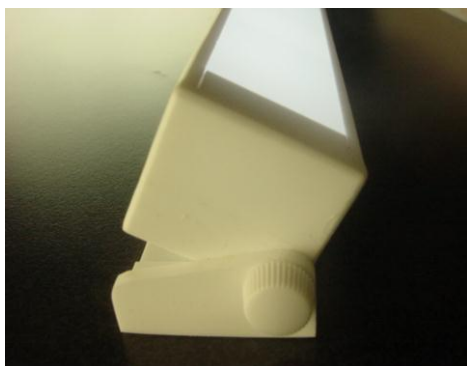
側面 溝無しタイプ